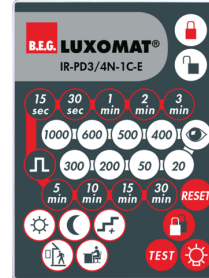
IR-PD3/4N-1C-E Art.No: 93110

Batteri: 3.0 V Lithium CR2032 inklusiv Dimensioner: 80 x 60 x 8 mm Materiale Farve: -