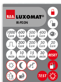
IR-PD3N Art.No: 92105

Dimensioner: 40 x 55 x 103 mm Materiale Farve: sort Frekvens: 2.4 GHz ISM band, GFSK 0.2 dBm + 5.3 dBi = 5.5 dBm