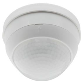
PD4-S-GH-P Art.No: 92265

To receive the bundle according to the technical specification, please order the items listed.