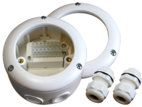
P-sokkel IP65 PD4-P IP54 Art.no: 92376

Dimensioner: Ø 115 x 70 mm Beskyttelsesgrad/-klasse: IP65 Beskyttelse mod slag: IK07