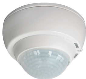
PD4-M-TRIO-K-3P-P Art.No: 92747

To receive the bundle according to the technical specification, please order the items listed.