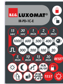
IR-PD-1C-E Art.No: 92077

Batteri: 3.0 V Lithium CR2032 inklusive Dimensioner: 80 x 60 x 8 mm Materiale Farve: -