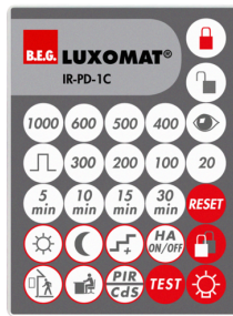
IR-PD-1C Art.No: 92520

Dimensioner: 40 x 55 x 103 mm Materiale Farve: sort Frekvens: 2.4 GHz ISM band, GFSK 0.2 dBm + 5.3 dBi = 5.5 dBm