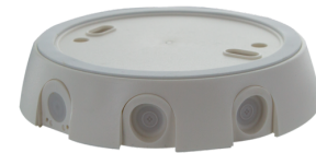
Sokkel/underlag IP54 PD4-TRIO-P Art.No: 92386

Dimensioner: Ø 200 x 90 mm Beskyttelse mod slag: IK09 Kabinet: Coated stålcurv