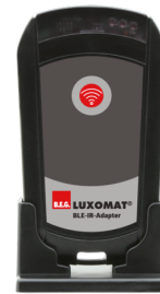
BLE-IR-Adapter Art.No: 93067

Spænding: 230 V AC \pm 10\% Dimensioner: 50 x 23 x 8 mm Beskyttelsesgrad/-klasse: IP20 / Klasse II