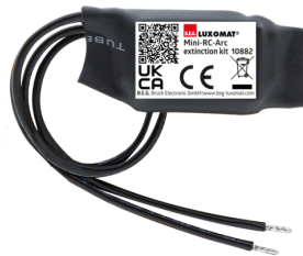
Mini-RC-dæmperled Art.No: 10882

Spænding: 230 V AC \pm 10\% Dimensioner: 38 x 12 x 26 mm Beskyttelsesgrad/-klasse: IP20 / Klasse II