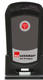
BLE-IR-Adapter Art.No: 93067

Spænding: 230 V AC \pm 10\% Dimensioner: 50 x 23 x 8 mm Beskyttelsesgrad/-klasse: IP20 / Klasse II