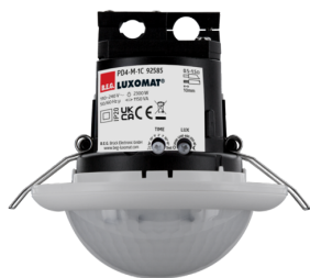
PD4-M-1C-i Art.No: 92585

To receive the bundle according to the technical specification, please order the items listed.