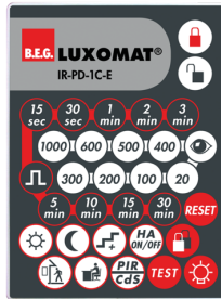
IR-PD-1C-E Art.no: 92077

Batteri: 3.0 V Lithium CR2032 inklusiv Dimensioner: 80 x 60 x 8 mm Materiale Farve: -