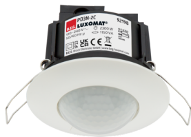
PD3N-2C-i Art.No: 92198

To receive the bundle according to the technical specification, please order the items listed.