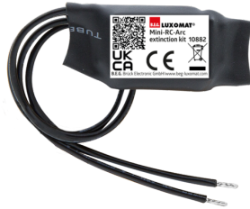
Mini-RC-dæmperled Art.no: 10882

Spænding: 230 V AC \pm 10\% Dimensioner: 38 x 12 x 26 mm Beskyttelsesgrad/-klasse: IP20 / Klasse II