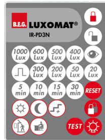
IR-PD3N Art.No: 92105

Batteri: 3.0 V Lithium CR2032 inklusiv Dimensioner: 80 x 60 x 8 mm Materiale Farve: -