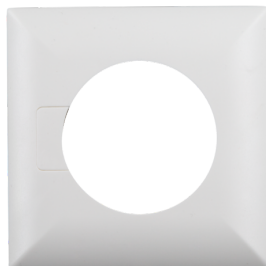
Firkantet designramme PD3N-i Art.No: 92991

Dimensioner: Ø 200 x 90 mm Beskyttelse mod slag: IK09 Kabinet: Coated stålkurv