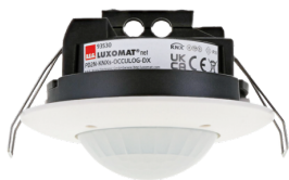
PD2N-KNXs-OCCULOG-DX-i Art.No: 93530

To receive the bundle according to the technical specification, please order the items listed.