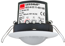
PD2-M-2C-12-48V-RR-i Art.No: 92306

To receive the bundle according to the technical specification, please order the items listed.