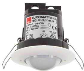
PD2-M-1C-i Art.No: 92565

To receive the bundle according to the technical specification, please order the items listed.