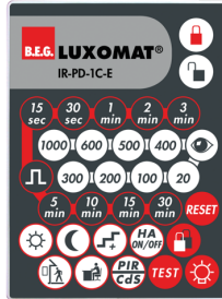
IR-PD-1C-E Art.No: 92077

Batteri: 3.0 V Lithium CR2032 inklusiv Dimensioner: 80 x 60 x 8 mm Materiale Farve: -