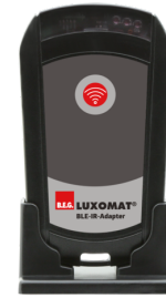
BLE-IR-Adapter Art.No: 93067

Spænding: 230 V AC \pm 10\% Dimensioner: 50 x 23 x 8 mm Beskyttelsesgrad/-klasse: IP20 / Klasse II