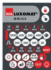
IR-PD-1C-E Art.No: 92077

Batteri: 3.0 V Lithium CR2032 inklusiv Dimensioner: 80 x 60 x 8 mm Materiale Farve: -