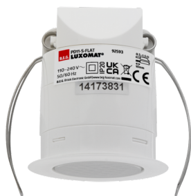
PD11-S-FLAT-i Art.No: 92593

To receive the bundle according to the technical specification, please order the items listed.