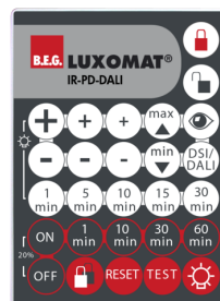
IR-PD-DALI Art.No: 92094

Dimensioner: 47 x 19 x 10 mm Beskyttelsesgrad/-klasse: IP20 Omgivelsestemperatur: -20 °C til +40 °C