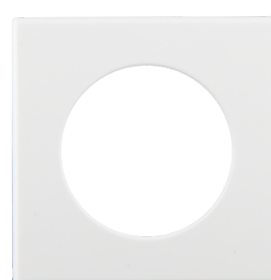
Firkantet designramme PD11-i Art.No: 92994

Dimensioner: Ø 100 x 3 mm Kabinet: UV-resistent polycarbonat af høj kvalitet Materiale Farve: hvid mat, svarende til RAL9010