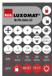
IR-PD-DALI-LD Art.No: 92652

Batteri: 3.0 V Lithium CR2032 inklusiv Dimensioner: 80 x 60 x 8 mm Materiale Farve: -