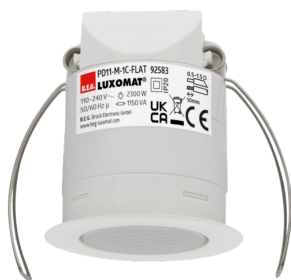
PD11-M-1C-FLAT-i Art.No: 92583

To receive the bundle according to the technical specification, please order the items listed.