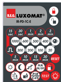
IR-PD-1C-E Art.No: 92077

Batteri: 3.0 V Lithium CR2032 inklusiv Dimensioner: 80 x 60 x 8 mm Materiale Farve: -