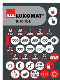
IR-PD-1C-E Art.no: 92077

Batteri: 3.0 V Lithium CR2032 inklusiv Dimensioner: 80 x 60 x 8 mm Materiale Farve: -