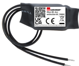
Mini-RC-dæmperled Art.No: 10882

Spænding: 230 V AC ±10% Dimensioner: 38 x 12 x 26 mm Beskyttelsesgrad/-klasse: IP20 / Klasse II