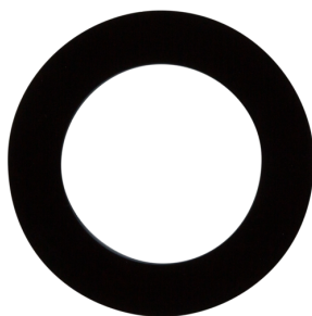
Afdækningsring PD11 (52 mm) Art.No: 92537

Dimensioner: Ø 104 mm Materiale Farve: hvid