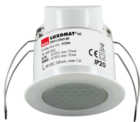
PD11-LTMS-RR-i Art.No: 92594

To receive the bundle according to the technical specification, please order the items listed.