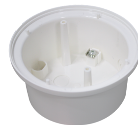
P-sokkel PD11 Art.no: 92121

Dimensioner: 54 x 54 x 2.6 mm Kabinet: UV-resistent polycarbonat af høj kvalitet Materiale Farve: hvid mat, svarende til RAL9010