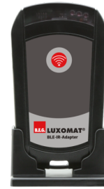
BLE-IR-Adapter Art.No: 93067

Spænding: 230 V AC \pm 10\% Dimensioner: 50 x 23 x 8 mm Beskyttelsesgrad/-klasse: IP20 / Klasse II