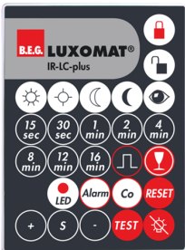
IR-LC-plus Art.No: 92095

Dimensioner: 40 x 55 x 103 mm Materiale Farve: sort Frekvens: 2.4 GHz ISM band, GFSK 0.2 dBm + 5.3 dBi = 5.5 dBm