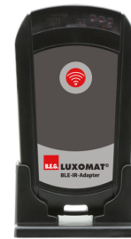
BLE-IR-Adapter Art.No: 93067

Spænding: 230 V AC \pm 10\% Dimensioner: 50 x 23 x 8 mm Beskyttelsesgrad/-klasse: IP20 / Klasse II