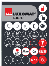
IR-LC-plus Art.No: 92095

Dimensioner: 40 x 55 x 103 mm Materiale Farve: sort Frekvens: 2.4 GHz ISM band, GFSK 0.2 dBm + 5.3 dBi = 5.5 dBm