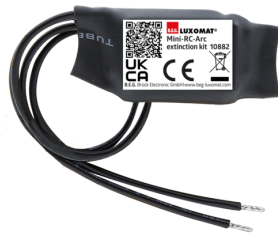
Mini-RC-dæmperled Art.No: 10882

Spænding: 230 V AC \pm 10\% Dimensioner: 38 x 12 x 26 mm Beskyttelsesgrad/-klasse: IP20 / Klasse II