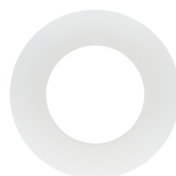
krycí kroužek PD9 Ø 36 mm Č. zboží: 92238

Rozměry: Ø 36 mm Bydlení: obal UV a nárazuvzdorný polykarbonát Barva materiálu: antracitová lesklý