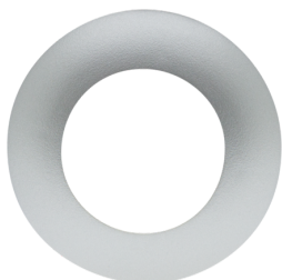
krycí kroužek PD9 Ø 36 mm Č. zboží: 92237

Rozměry: Ø 36 mm Bydlení: obal UV a nárazuvzdorný polykarbonát Barva materiálu: bílá lesklý