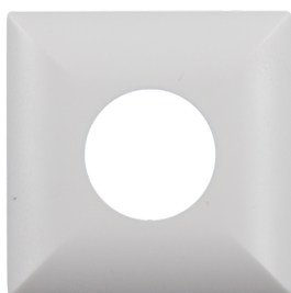
čtvercový designový rám PD9-FC Č. zboží: 92993

Rozměry: Ø 45 mm Barva materiálu: stříbrná mat