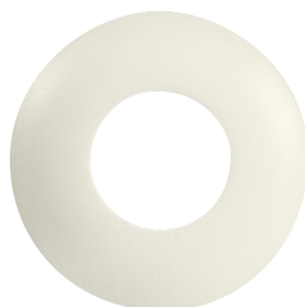
krycí kroužek PD9 Ø 45 mm Č. zboží: 92327

Rozměry: Ø 36 mm Bydlení: obal UV a nárazuvzdorný polykarbonát Barva materiálu: stříbrná lesklý