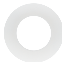
krycí kroužek PD9 Ø 36 mm Art.No: 92238

Rozměry: Ø 36 mm Bydlení: obal UV a nárazuvzdorný polykarbonát Barva materiálu: antracitová lesklý