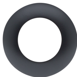
krycí kroužek PD9 Ø 36 mm Č. zboží: 92235

Stupeň krytí: IP65 Bydlení: obal UV a nárazuvzdorný Barva materiálu: průhledný