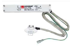
PD9-M-1C-FC Č. zboží: 92900

Pro získání sady podle technické specifikace objednejte uvedené položky.