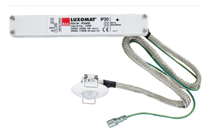
PD9-M-1C-FC Č. zboží: 92900

Pro získání sady podle technické specifikace objednejte uvedené položky.