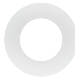
krycí kroužek PD9 Ø 36 mm Č. zboží: 92238

Stupeň krytí: IP65 Bydlení: obal UV a nárazuvzdorný Barva materiál: průhledný