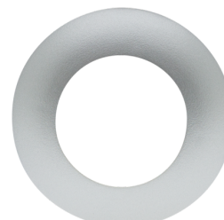
krycí kroužek PD9 Ø 36 mm Č. zboží: 92237

Stupeň krytí: IP65 Bydlení: obal UV a nárazuvzdorný Barva materiál: průhledný