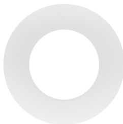
krycí kroužek PD9 Ø 36 mm Č. zboží: 92238

Napětí: 230 V AC \pm 10\% Rozměry: 50 x 23 x 8 mm Stupeň krytí: IP20 / třída II