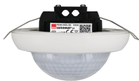
PD4N-KNXs-BA-FC Č. zboží: 93535

Pro získání sady podle technické specifikace objednejte uvedené položky.