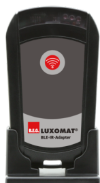
BLE-IR-adaptér Č. zboží: 93067

Rozměry: 40 x 55 x 103 mm Barva materiál: černá Frekvence: 2.4 GHz ISM band, GFSK 0.2 dBm + 5.3 dBi = 5.5 dBm