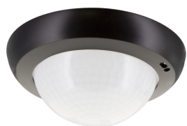
lens PD4N, krycí kroužek Č. zboží: 93733

Detekční rozsah: vodorovný 360° (stropní montáž) Dosah: max. &Oslash; 24 m křížem<br>max. &Oslash; 8 m přímo<br>max. &Oslash; 6.4 m sedící Sledovaná oblast (pohyb křížem): 450 m 2 / 2.5 m montážní výška