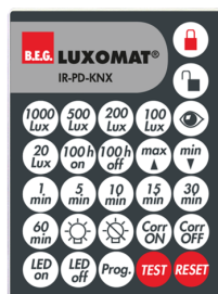
IR-PD-KNX Č. zboží: 92123

Rozměry: 40 x 55 x 103 mm Barva materiál: černá Frekvence: 2.4 GHz ISM band, GFSK 0.2 dBm + 5.3 dBi = 5.5 dBm