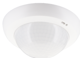
lens PD4N, krycí kroužek Č. zboží: 93732

Detekční rozsah: vodorovný 360° (stropní montáž) Dosah: max. &Oslash; 24 m křížem<br>max. &Oslash; 8 m přímo<br>max. &Oslash; 6.4 m sedící Sledovaná oblast (pohyb křížem): 450 m 2 / 2.5 m montážní výška