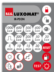
IR-PD3N Art.No: 92105

Rozměry: 40 x 55 x 103 mm Barva materiál: černá Frekvence: 2.4 GHz ISM band, GFSK 0.2 dBm + 5.3 dBi = 5.5 dBm