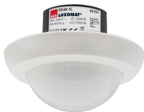
PD4N-1C-FM Č. zboží: 92151

Pro získání sady podle technické specifikace objednejte uvedené položky.