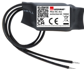
mini-odrušovací člen Č. zboží: 10882

Napětí: 230 V AC ±10% Rozměry: 38 x 12 x 26 mm Stupeň krytí: IP20 / třída II