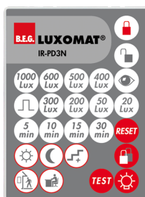
IR-PD3N Art.No: 92105

Rozměry: 47 x 19 x 10 mm Stupeň krytí: IP20 Okolní teplota: -20 °C až +40 °C