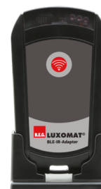
BLE-IR-adapter Č. zboží: 93067

Napětí: 230 V AC ±10% Rozměry: 50 x 23 x 8 mm Stupeň krytí: IP20 / třída II