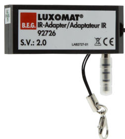
IR-adapter pro chytré telefony Art.No: 92726

Rozměry: 40 x 55 x 103 mm Barva materiál: černá Frekvence: 2.4 GHz ISM band, GFSK 0.2 dBm + 5.3 dBi = 5.5 dBm