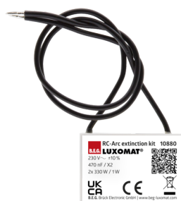
odrušovací člen Č. zboží: 10880

Napětí: 230 V AC ±10% Rozměry: 38 x 12 x 26 mm Stupeň krytí: IP20 / třída II