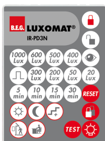
IR-PD3N Art.No: 92105

Rozměry: 47 x 19 x 10 mm Stupeň krytí: IP20 Okolní teplota: -20 °C až +40 °C