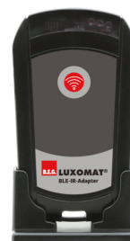
BLE-IR-adapter Č. zboží: 93067

Napětí: 230 V AC ±10% Rozměry: 50 x 23 x 8 mm Stupeň krytí: IP20 / třída II