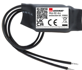
mini-odrušovací člen Č. zboží: 10882

Napětí: 230 V AC ±10% Rozměry: 38 x 12 x 26 mm Stupeň krytí: IP20 / třída II