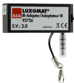
IR-adapter pro chytré telefony Č. zboží: 92726

Rozměry: 40 x 55 x 103 mm Barva materiál: černá Frekvence: 2.4 GHz ISM band, GFSK 0.2 dBm + 5.3 dBi = 5.5 dBm