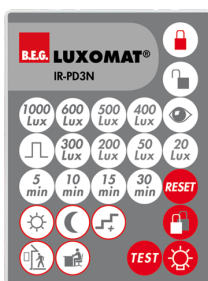
IR-PD3N Č. zboží: 92105

Rozměry: 47 x 19 x 10 mm Stupeň krytí: IP20 Okolní teplota: -20 °C až +40 °C