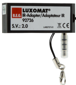
IR-adapter pro chytré telefony Art.No: 92726

Rozměry: 40 x 55 x 103 mm Barva materiál: černá Frekvence: 2.4 GHz ISM band, GFSK 0.2 dBm + 5.3 dBi = 5.5 dBm