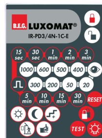
IR-PD3/4N-1C-E Art.No: 93110

Rozměry: 80 x 60 x 8 mm Barva materiál: - Accu: lithium 3.0 V <BR>0 mAh