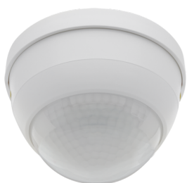
PD4-S-C-SM Č. zboží: 92442

Pro získání sady podle technické specifikace objednejte uvedené položky.