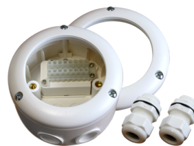
podstavec SM IP65 PD4-SM IP54 Č. zboží: 92376

Rozměry: Ø 200 x 90 mm Odolnost vůči rázu: IK09 Bydlení: lakovaný ocelový koš