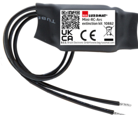
mini-odrušovací člen Č. zboží: 10882

Napětí: 230 V AC ±10% Rozměry: 38 x 12 x 26 mm Stupeň krytí: IP20 / třída II