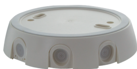
zásuvka IP54 PD4-TRIO-SM Č. zboží: 92386

Rozměry: Ø 164 x 143 mm Odolnost vůči rázu: IK09 Bydlení: lakovaný ocelový koš