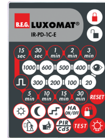
IR-PD-1C-E Č. zboží: 92077

Rozměry: 57 x 35 x 7 mm Barva materiál: - Accu: lithium 3.0 V <BR>0 mAh