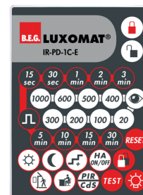
IR-PD-1C-E Č. zboží: 92077

Rozměry: 57 x 35 x 7 mm Barva materiál: - Accu: lithium 3.0 V <BR>0 mAh