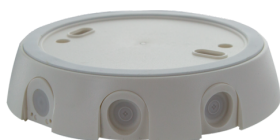
zásuvka IP54 PD4-TRIO-SM Art.No: 92386

Rozměry: 80 x 60 x 8 mm Barva materiál: - Accu: lithium 3.0 V<BR>0 mAh