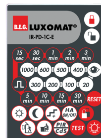
IR-PD-1C-E Art.No: 92077

Rozměry: 57 x 35 x 7 mm Barva materiál: - Accu: lithium 3.0 V<BR>0 mAh