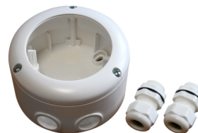
podstavec SM IP65 pro PD4-SM IP20 Č. zboží: 92375

Rozměry: Ø 200 x 90 mm Odolnost vůči rázu: IK09 Bydlení: lakovaný ocelový koš