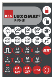
IR-PD-LD Art.No: 92479

Rozměry: 40 x 55 x 103 mm Barva materiál: černá Frekvence: 2.4 GHz ISM band, GFSK 0.2 dBm + 5.3 dBi = 5.5 dBm