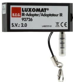
IR-adaptér pro chytré telefony Č. zboží: 92726

Rozměry: \varnothing 100 x 15 mm Stupeň krytí: IP54 Bydlení: obal UV a nárazuvzdorný polykarbonát