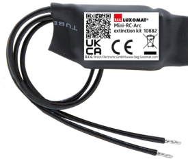
mini-odrušovací člen Č. zboží: 10882

Napětí: 230 V AC ±10% Rozměry: 38 x 12 x 26 mm Stupeň krytí: IP20 / třída II