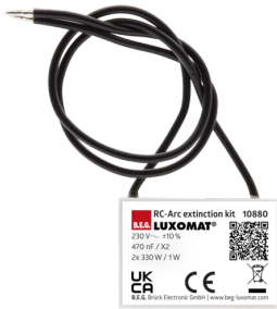
odrušovací člen Č. zboží: 10880

Napětí: 230 V AC ±10% Rozměry: 38 x 12 x 26 mm Stupeň krytí: IP20 / třída II