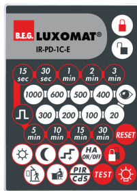
IR-PD-1C-E Č. zboží: 92077

Rozměry: 80 x 60 x 8 mm Barva materiál: - Accu: lithium 3.0 V <BR>0 mAh