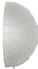
krycí lamela PD4 Č. zboží: 92313

Rozměry: Ø 200 x 90 mm Odolnost vůči rázu: IK09 Bydlení: lakovaný ocelový koš