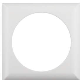
čtvercový designový rám PD4-FC Č. zboží: 92992

Napětí: 110 – 240 V AC 50 / 60 Hz Rozměry: Ø 97 x 103 mm Spotřeba elektrické energie: ca. 0.4 W