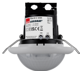
PD4-M-1C-FC Č. zboží: 92585

Pro získání sady podle technické specifikace objednejte uvedené položky.