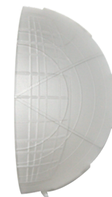
krycí lamela PD4 Č. zboží: 92313

Rozměry: 101 x 101 x 11.8 mm Bydlení: obal UV a nárazuvzdorný polykarbonát Barva materiál: čistě bílá mat, podobný RAL9010