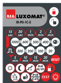
IR-PD-1C-E Č. zboží: 92077

Rozměry: 80 x 60 x 8 mm Barva materiál: - Accu: lithium 3.0 V <BR>0 mAh