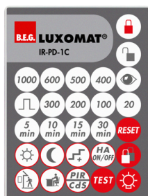
IR-PD-1C Č. zboží: 92520

Rozměry: 40 x 55 x 103 mm Barva materiál: černá Frekvence: 2.4 GHz ISM band, GFSK 0.2 dBm + 5.3 dBi = 5.5 dBm