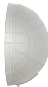
krycí lamela PD4 Č. zboží: 92313

Rozměry: 130 x 100 x 53 mm Bydlení: obal UV a nárazuvzdorný polykarbonát Barva materiál: bílá