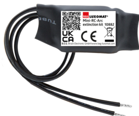
mini-odrušovací člen Č. zboží: 10882

Napětí: 230 V AC ±10% Rozměry: 38 x 12 x 26 mm Stupeň krytí: IP20 / třída II