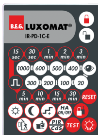
IR-PD-1C-E Art.No: 92077

Rozměry: 80 x 60 x 8 mm Barva materiál: - Accu: lithium 3.0 V <BR>0 mAh