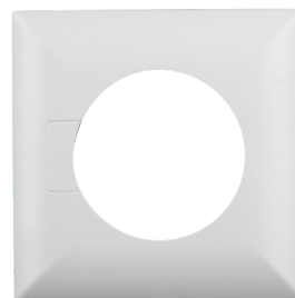
čtvercový designový rám PD3N-FC Č. zboží: 92991

Rozměry: Ø 200 x 90 mm Odolnost vůči rázu: IK09 Bydlení: lakovaný ocelový koš