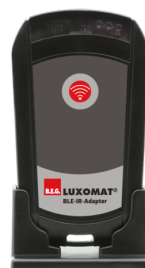
BLE-IR-adaptér Č. zboží: 93067

Napětí: 230 V AC ±10% Rozměry: 50 x 23 x 8 mm Stupeň krytí: IP20 / třída II