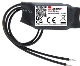
mini-odrušovací člen Č. zboží: 10882

Napětí: 230 V AC ±10% Rozměry: 38 x 12 x 26 mm Stupeň krytí: IP20 / třída II