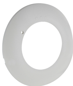
krycí kroužek PD2N FC Č. zboží: 93772

Napětí: z KNX-BUS-sítě Rozměry: Ø 83 x 55 mm Elektřina: 12 mA