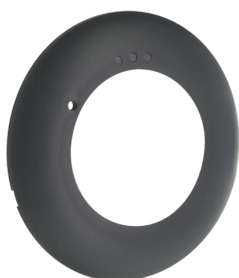
krycí kroužek PD2N FC Č. zboží: 93771

Napětí: z KNX-BUS-sítě Rozměry: Ø 83 x 55 mm Elektřina: 12 mA